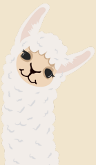
LAMA chová se na vlnu a dá se na ní jezdit. slouží k přepravě nákladů