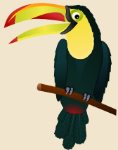
TUKAN má dlouhý zobák živí se plody a bobulemi