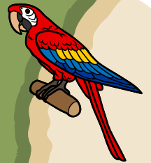
ARA nejznámější papoušek výskyt je v přírodě ohrožen