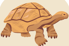
ŽELVA SLONÍ žije pouze na Galapágách, je největší suchozemská želva na světě