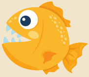
PIRAÑA Masožravá ryba, která žere savce a hlodavce. Najdeme ji v Amazonce.