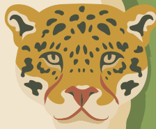
JAGUÁR největší kočkovitá šelma výborně plave a šplhá