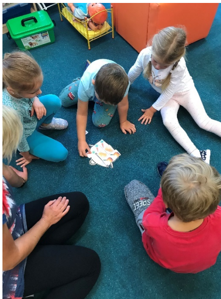
Obrázek 5 - práce ve skupině