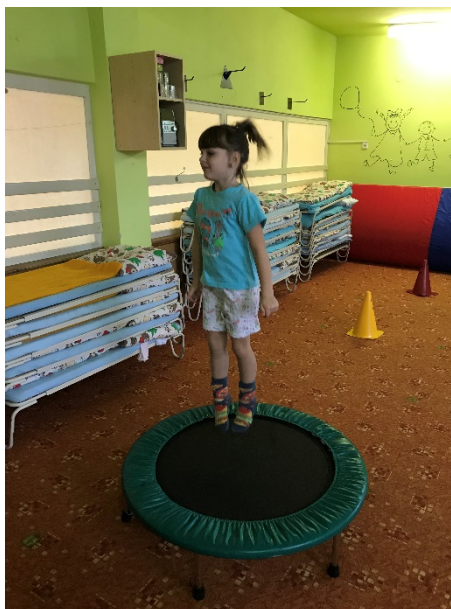
Obrázek 21 - skok na trampolíně

3x skok na trampolíně a seskočit snožmo dolů