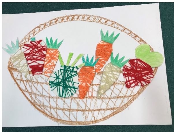
Obrázek 22 - zeleninový košík