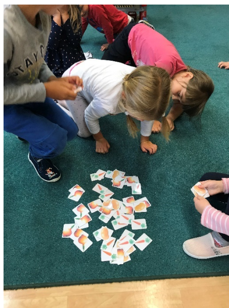
Obrázek 4 - „Nákup“ zeleniny