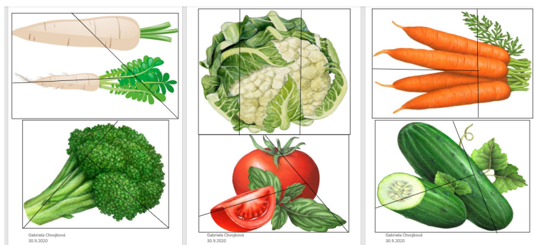
Obrázek 2 - ukázka obrázků zeleniny na skládání

Hodnocení: Já jsem obrázky rozstříhala nerovnoměrně, tudíž vznikly různé tvary (trojúhelníky, čtyřúhelníky, lichoběžníky, ...). Zvolila jsem těžší variantu, neboť většinou při těchto nebo podobných činnostech obrázky stříháme na stejné, rovnoměrné pruhy. Překvapilo mne, že málokteré dítě s tím mělo problémy. Většinou děti dokázaly složit samy, v některých případech dělalo problém například v tom, že si nedokázalo správně dílek otočit daným směrem.