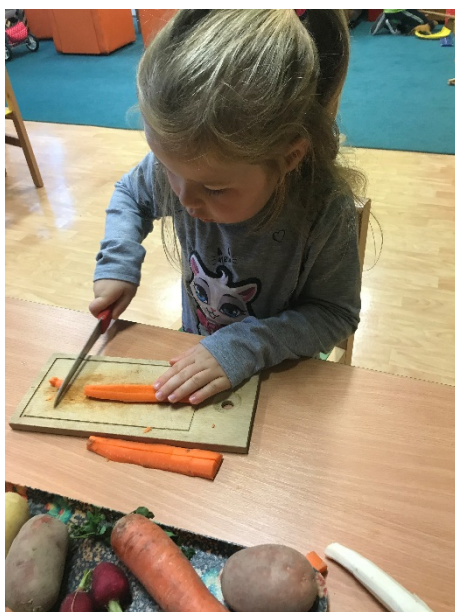
Obrázek 17 - krájení zeleniny - malé děti