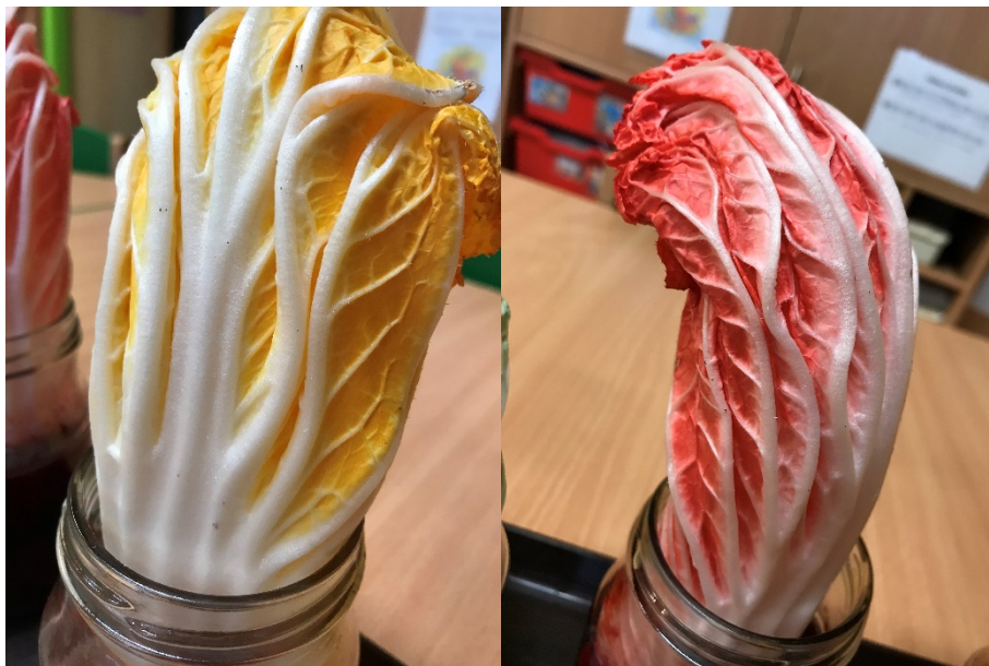
Obrázek 8 - ukázka zbarvení jednotlivých barev