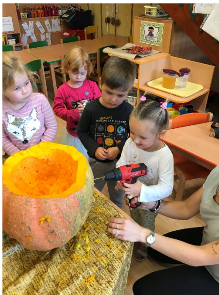
Obrázek 12 - samostatná práce dětí - vrtání do dýně