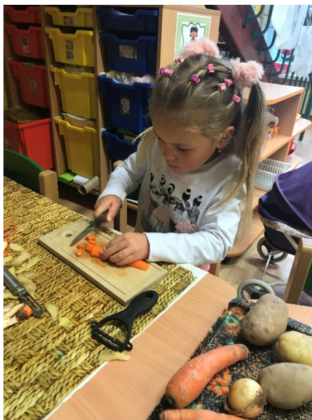
Obrázek 16 - krájení zeleniny - předškolní dívka

Hodnocení: Děti před začátkem krájení zeleniny, samotném vaření polévky, i během celé činnosti byly poučovány o bezpečnosti a bezpečném pohybu kolem horkého hrnce s polévkou, o bezpečném zacházení s nožem apod. Dětem polévka chutnala a měly radost z toho, že si něco samy uvařily a mohly své jídlo i ochutnat. Děti dodržovaly jak pravidla bezpečnosti, tak i čistotu a pořádek.