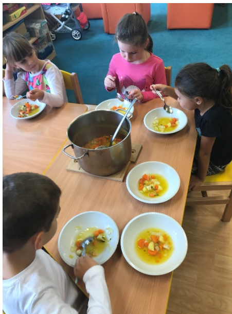
Obrázek 18 - ochutnávka polévky