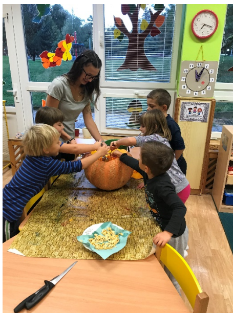
Obrázek 6 - dlabání dýně s dětmi