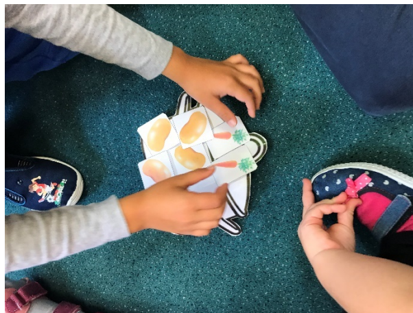
Obrázek 3 - vkládání zeleniny do hrnce

Hodnocení: Při této aktivitě děti počítaly do šesti. Zvládly to skvěle. Děti se při této činnosti krásně učí práci s chybou a chybu napravit. Činnost děti bavila.