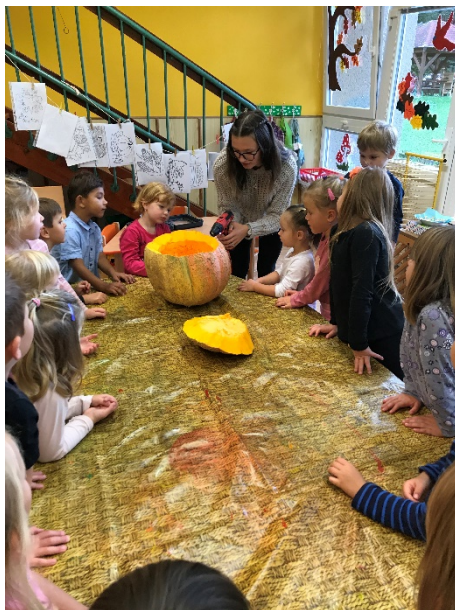
Obrázek 10 - zahájení činnosti - ukázka dětem

Hodnocení: Děti namotivovalo k činnosti už jen to, že jsem jim ukázala s čím budeme pracovat. Pár dětí s vrtačkou již pracovaly doma, ale pro většinu dětí to byla premiéra, a tak je činnost nadchla, že jsem musela dětem slíbit, že to není naposledy co budeme s tímto nástrojem pracovat. Bylo to pro děti něco nového, ze začátku jsem měla obavy kvůli bezpečnosti, ale překvapilo mě, jak děti byly ohleduplné, dodržovaly rozestupy tak, jak jim bylo před činností řečeno.