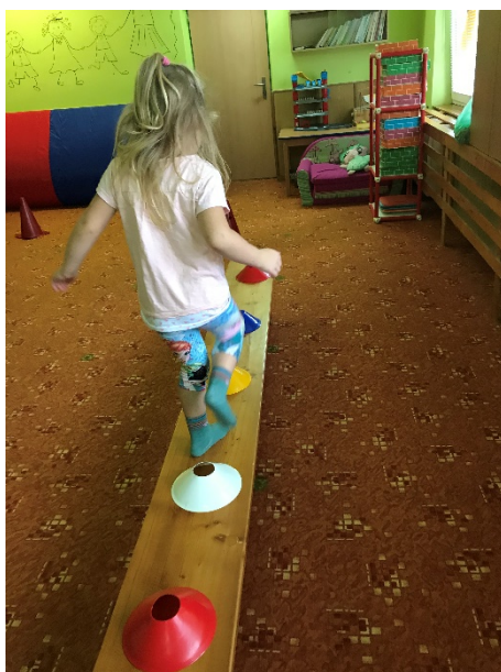
Obrázek 20 - překračování zeleniny

Chůze po lavičce s překračováním met – destičky, overbaly, kuželky, ... (Jdeme záhonkem a snažíme se nezašlápnou mrkvičky)