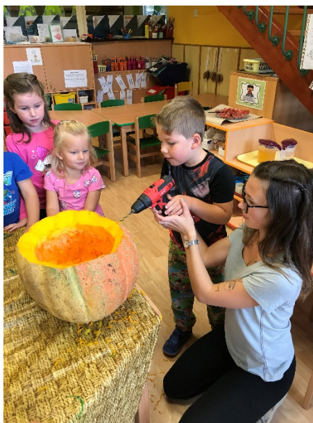
Obrázek 11 - samotná práce dětí - pomoc dětem od pi.učitelky