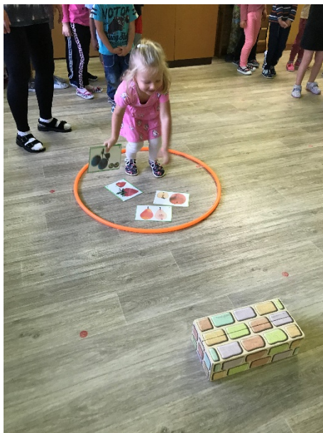
Obrázek 9 - pohybová aktivita - ukázka