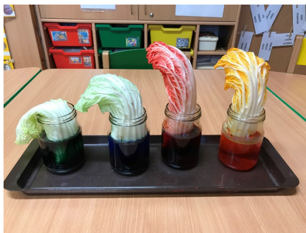
Obrázek 7 - zeleninový pokus

Hodnocení: Listy se začínaly velice rychle zbarvovat, což bylo dobré, že jsme viděli změnu už v ten den. Děti byly natěšené, co se s listy stane a výsledek je udivoval.