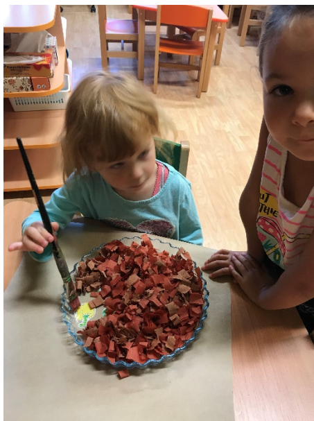
Obrázek 14 - hledání zeleniny

Hodnocení: Děti byly zvědavé, co pod „hlínou“ najdou. S nadšením s touto jednoduchou pomůckou pracovaly. Pojmenovávali jsme najitou zeleninu a povídali si o ni.