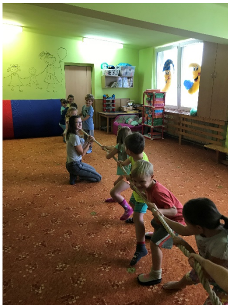
Obrázek 19 - přetahování lana

Podávání míče kolem těla, podávání míče ve skupině a v kruhu – (míč představuje rajče, nesmí nám spadnout, aby se nerozmáčklo)