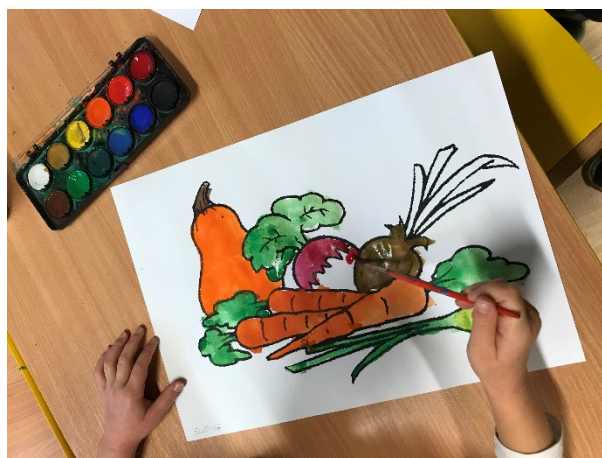
Obrázek 15 - vymalování zeleniny

Hodnocení: Opravdu jednoduchá činnost pro přípravu, ale děti velice zaujala. Poté jsme si o výsledcích společně povídali, říkali jsme si, jakou barvu by mohla daná zelenina ještě mít, jak chutná a jak se nám omalovánka povedla, jak nás činnost bavila a zda nám přišlo něco složité.