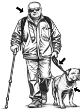
16) vodící / vodící