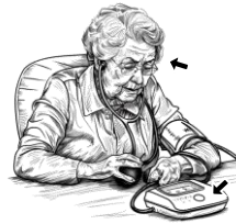
21) měřící / měřící