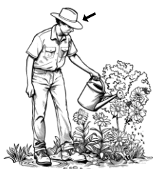
4) kropicí / kropicí