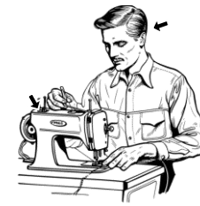
12) šící / šijící