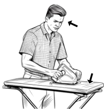
2) žehlicí / žehlicí