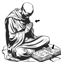
8) modlicí / modlicí