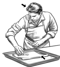
6) pečicí / pečicí