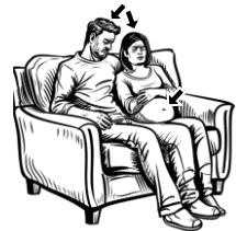
19) trávící / trávící