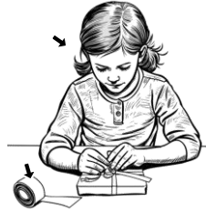
11) lepící / lepící