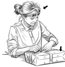
18) balící / balící