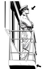
20) velící / velící