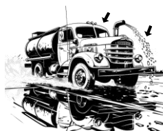
22) kropící / kropící