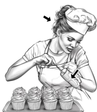
1) zdebicí / zdebicí

Podívejte se na obrázek výše. Pojmenujte podobně předměty s šipkou na obrázcích níže, a to ve slovních spojeních či větách.