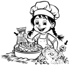
10) kypřící / kypřící