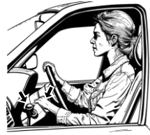
17) řadící / řadící