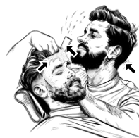
7) holicí / holicí