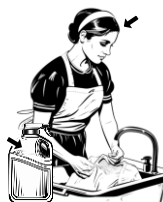
5) čisticí / čisticí