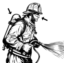
3) hasicí / hasicí