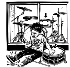
14) bicí / bijící