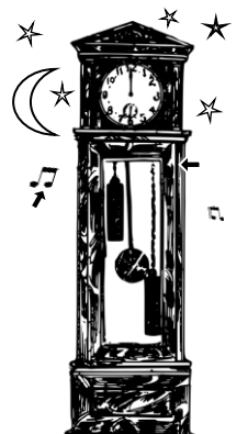
15) bicí / bijící