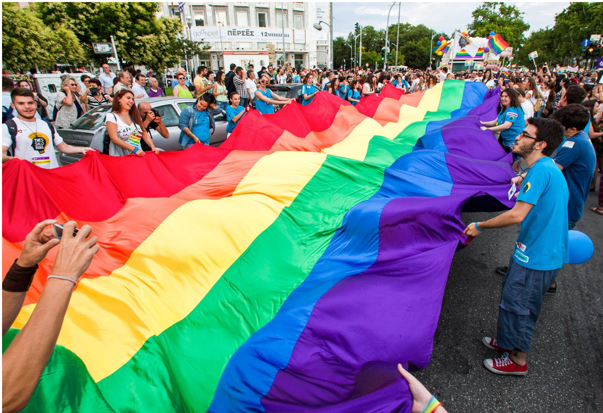
Prague Pride 2023