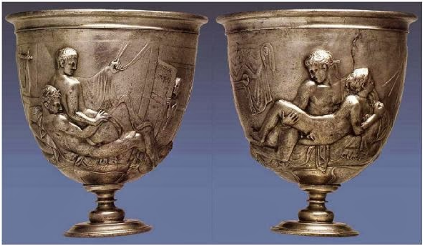
Warren Cup – Britské národní muzeum 1. st. n. l.