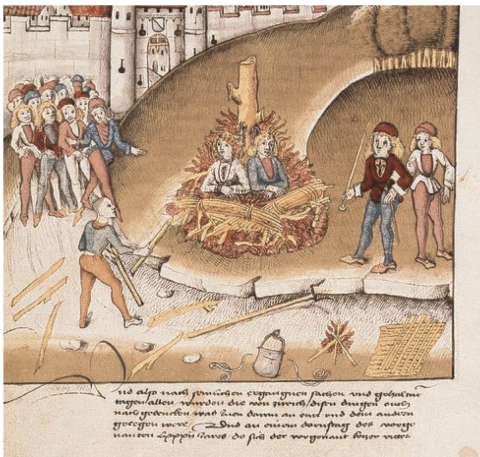
Upálení dvou mladíků v Curychu 1482