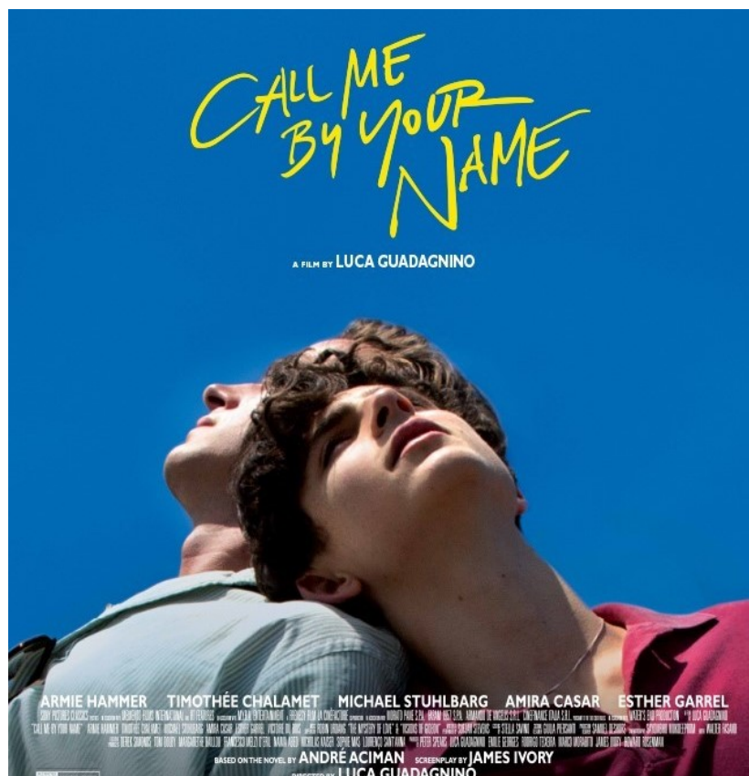
Film Call Me by Your Name natočený podle stejnojmenné knihy, 2017