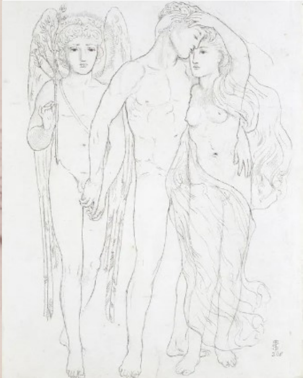
Nevěsta, ženich a smutný milenec od S.

V 19. století byl uvězněn Oscar Wilde (anglický spisovatel) za homosexualitu na dva roky.