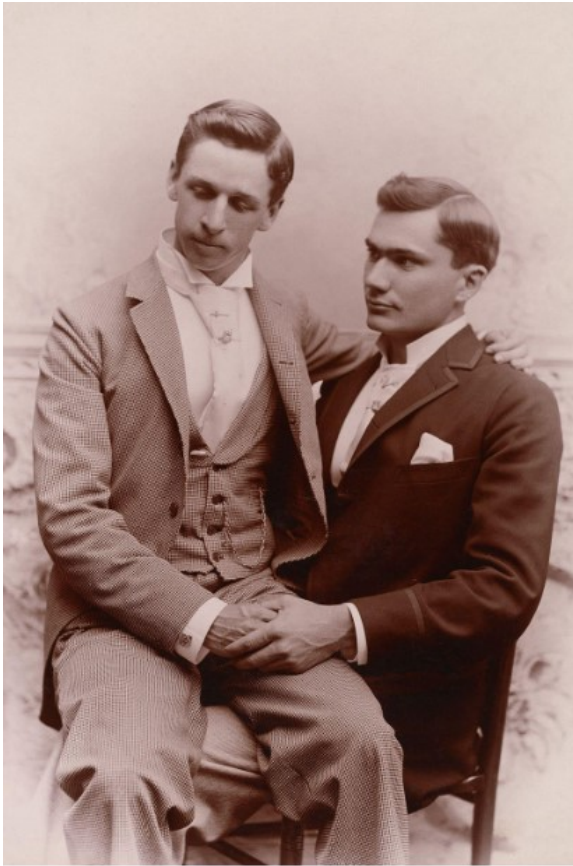
Portrét dvou mužů z roku 1880, USA Solomon, 1865, UK