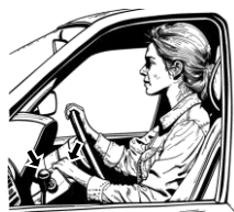
17) řadící / řadící