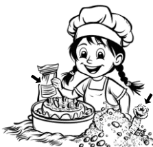
10) kypřící / kypřící