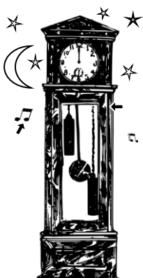
15) bicí / bijící