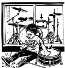
14) bicí / bijící