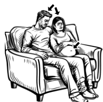
19) trávící / trávící