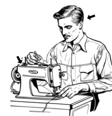
12) šicí / šijící