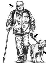
16) vodící / vodící