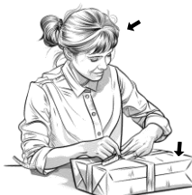
18) balící / balící