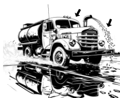
22) kropící / kropící