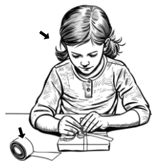
11) lepící / lepící