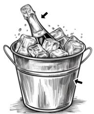
13) chladící / chladící