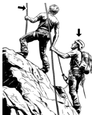
9) jistící / jistící