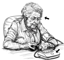
21) měřící / měřící